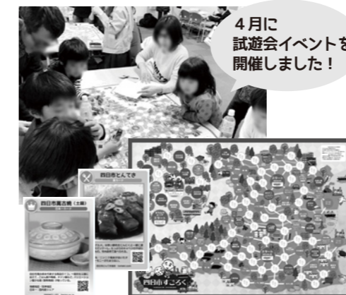
4月に 試遊イベントを 開催しました!

今回、トゥモローズは四日市の魅力をみんなに知ってもらうために「四日市すざろく」を作りました！ 遊びながら四日市のいいところやオススメスポット、名産品を知ることのできるゲームです。なんと、NHK「ほっとイブニングみえ」という番組でも紹介されました！大人も白熱しちゃう面白さ！みんなはどれくらい四日市のいいところ知っていますか？きんせいにもあるのでぜひ遊びにきてね★